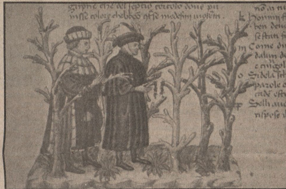
Dante i Virgili al bosc vivent, segons una miniatura del segle V, que il·lustra «La Divina Comèdia» (Biblioteca Medicea-Laurenziana, Florència)