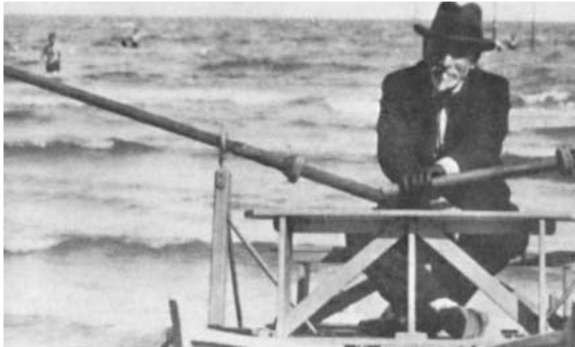
Luigi Pirandello va aconseguir el premi Nobel l'any 1934, poc abans de morir.

Pirandello va expressar el seu pessimisme i el seu pesar per la confusa condició de la humanitat a través de l'humor. No obstant això, la seva obra no deixa de tenir un regust amarg en què es reconeix els aspectes absurds de l'existència. Va exercir una gran influència en alliberar el teatre contemporani de les des-