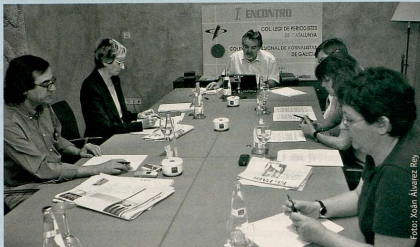
Un moment de la reunió entre periodistes catalans i gallecs

El Col·legi de Periodistes de Catalunya (CPC) i el Colexio Profesional de Xornalistas de Galícia (CPXC) han acordat crear una federació de col·legis de periodistes de tot l'Estat i que, inicialment, estarà integrada per aquestes dues institucions i oberta a altres col·legis que puguin constituir-se en un futur.