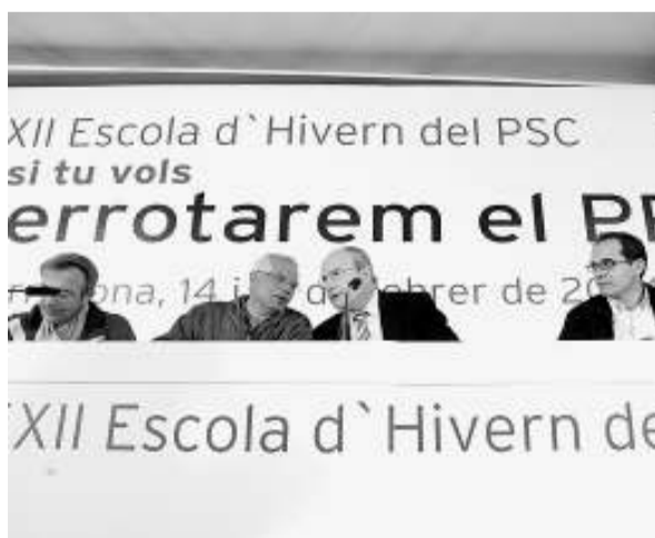
L'eslògan «Derrotarem el PP» presidia l'escola d'hivern del PSC.

No sé si el principal, però un dels eslògans del PSC per a la campanya electoral de les eleccions generals és Derrotarem el PP . D'entrada és un propòsit prou lloable, tenint en compte la implacable prepotència amb què ha governat José María Aznar. També és remarcable el fet que la sigla del Partit Popular arribi a formar part del lema d'un partit que li és un opositor reconegut. Potser m'equivoco, però em fa l'efecte que el partit d'Aznar té tan menjada la moral als socialistes, que aquests no són capaços de fer ni desfer res que no sigui en funció de tot el que fa i desfà el PP. Fins al punt que un dia d'aquests vaig sentir a dir a Rodríguez Zapatero que l'objectiu del seu partit era que el PP no renovés la majoria absoluta. És com quan en el futbol es juga per empatar; se sol perdre la majoria de les vegades. Em fa l'efecte, doncs, que el PSOE surt a la cursa electoral amb massa moral menjada per arribar a la meta amb cap mena d'avantatge. És clar que això són només sensacions