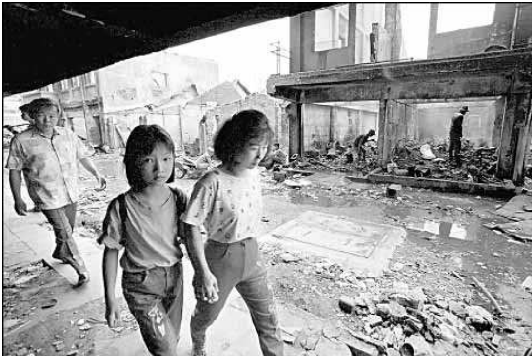
Una imatge presa aquesta setmana en una Jakarta totalment desolada

El clan familiar de l'expresident controla el país