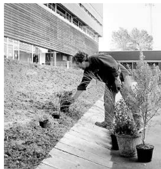
Un moment de la plantada simbòlica, ahir al matí.

recció d'empreses (245). Els menys sol·licitats són filologia hispànica (17 participants) i filologia catalana (21). «Són dades que ens permeten prendre el pols de les preferències dels futurs estudiants», va indicar el vicerector David Brusi en la presentació de la jornada, ahir al matí.