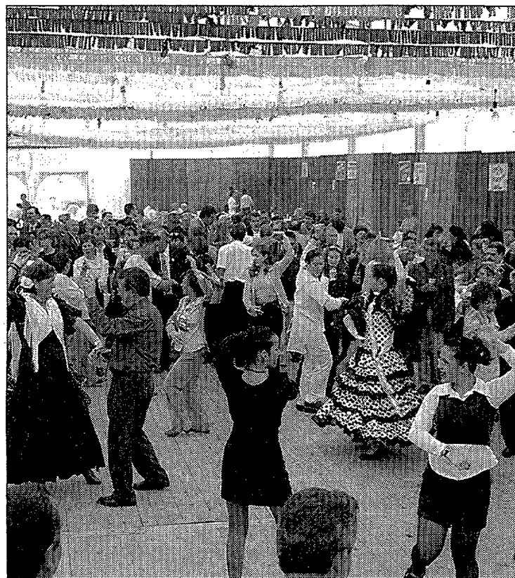
Les exhibicions de ball van aixecar molta expectació.

Al clos de fires també hi té una caseta l'associació Al-Andalus, que també ha programat actuacions amb Siroco, Caco y sus rumberos i el Cor de la Casa Cultural de Palamós. / R.C.