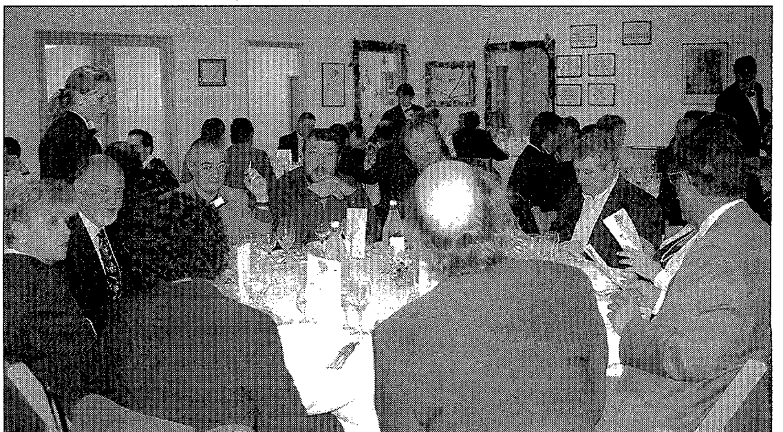
Els nominats als premis Empordà, durant el dinar en què es van lliurar els guardons.