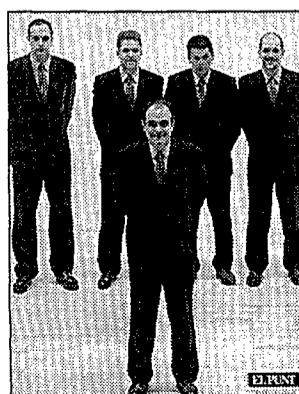
Els dos últims cromos de l'àlbum dels Gavis