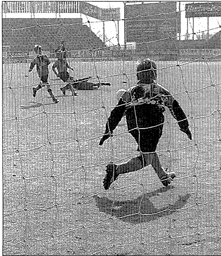
El terreny de joc de la Unió es va dividir en tres camps.