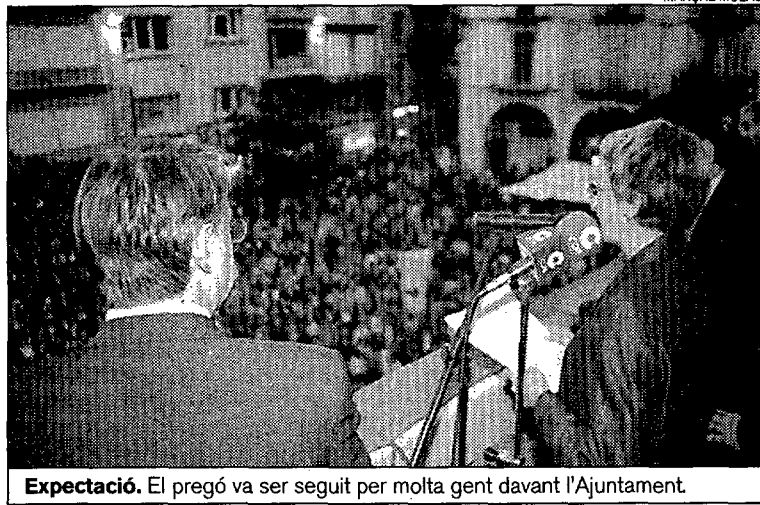
Expectació. El pregó va ser seguit per molta gent davant l'Ajuntament.