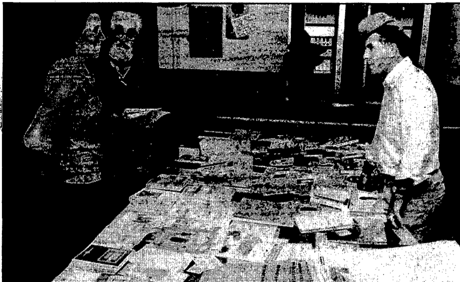
A l'entrada de l'Institut s'agrupen les taules amb les publicacions més diverses.

Universitat Catalana d'Estiu de Prada de Conflent (Catalunya Nord)