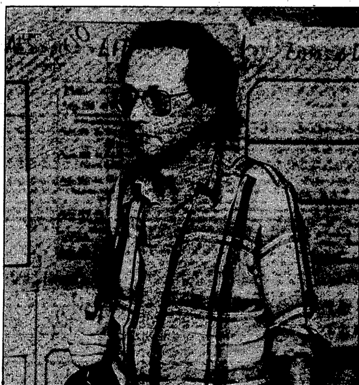
Joan Miró fa classes en una secció de químiques.