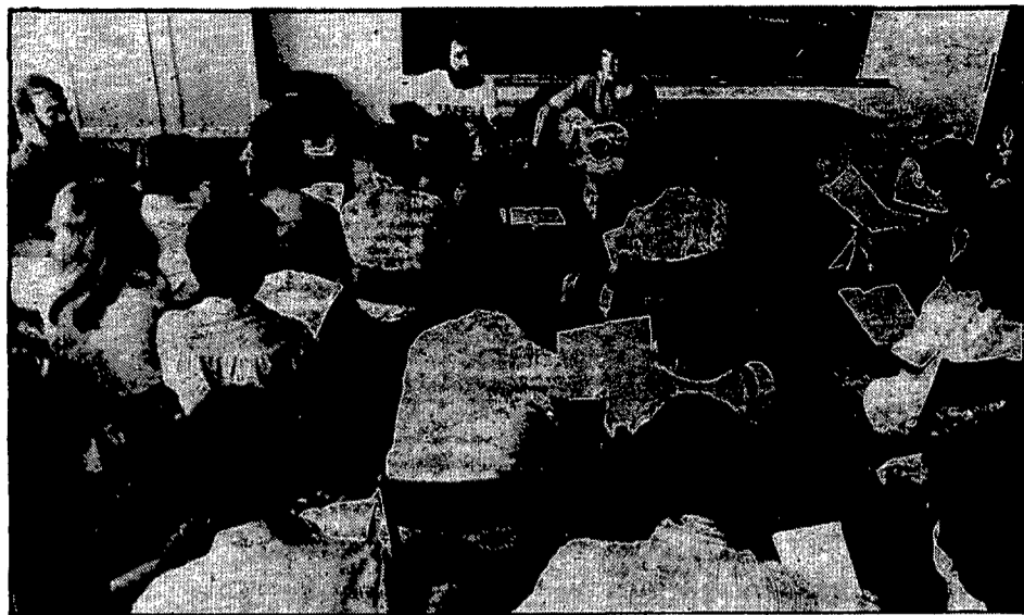
Catalunya Sud i les Illes són els que hi tenen més participants.