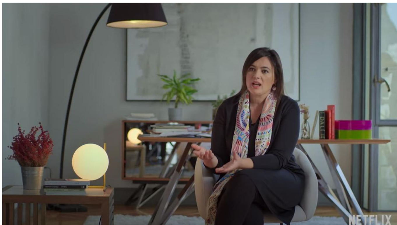
La periodista Anna Teixidor en un moment de la sèrie "800 metros"

Figueres | 14·07·23 | 15:51 | Actualitzat a les 17:40